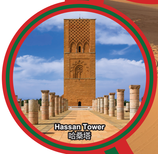
Hassan Tower 哈桑塔

行程次序，以當地旅社安排為準。 Sequences of Itinerary are subject to local arrangement.