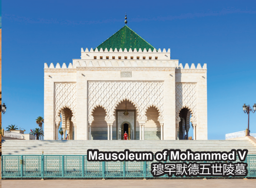
Mausoleum of Mohammed V 穆罕默德五世陵墓