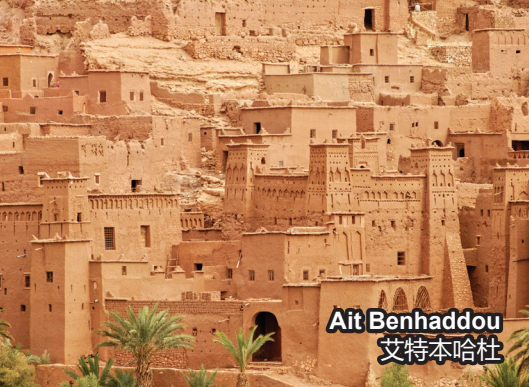
Ait Benhaddou 艾特本哈杜