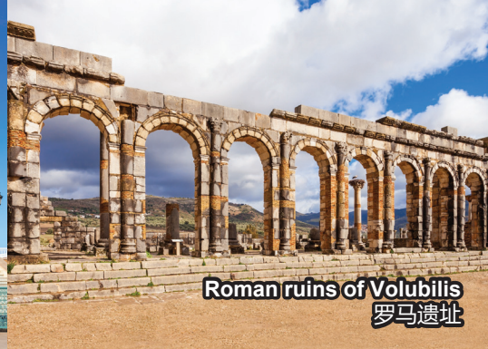
Roman ruins of Volubilis 罗马遗址