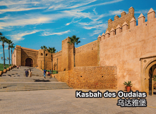
Kasbah des Oudaias 乌达雅堡