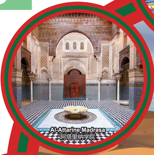
Al-Attarine Madrasa 阿塔里纳学院