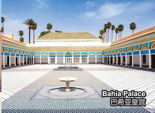
Bahia Palace 巴希亚皇宫