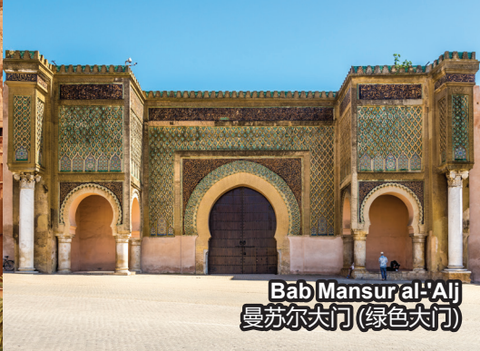
Bab Mansur al-'Ali 曼苏尔大门 (绿色大门)