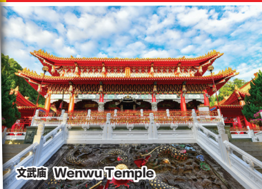
文武廟 Wenwu Temple