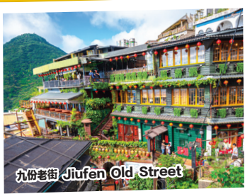
九份老街 Jiufen Old Street