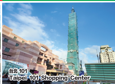
台北 101 Taipei 101 Shopping Center