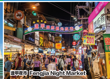
逢甲夜市 Fengjia Night Market