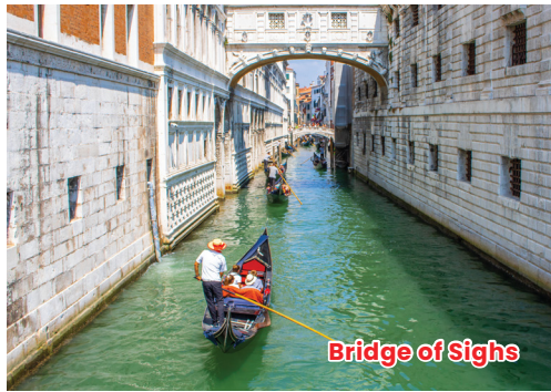
Bridge of Sighs