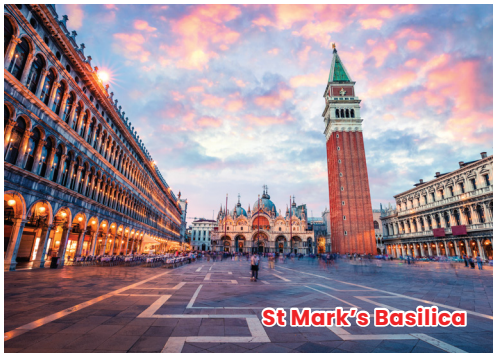
St Mark's Basilica