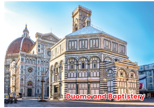
Duomo and Baptistery