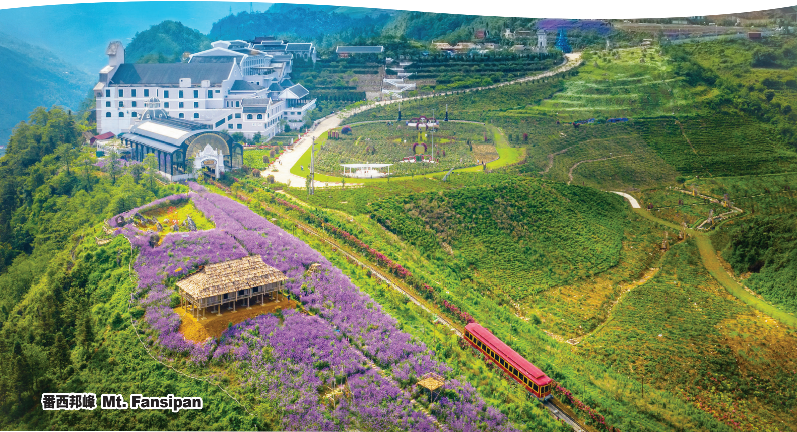
番西邦峰 Mt. Fansipan