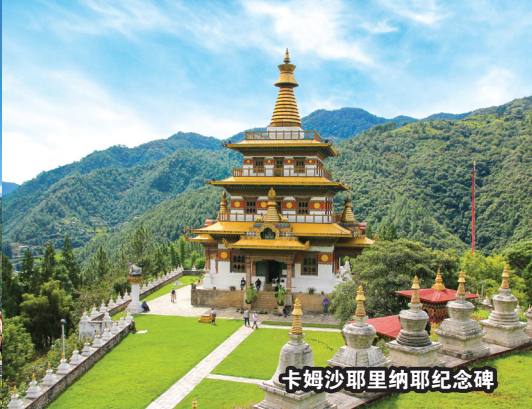
卡姆沙耶里纳耶纪念碑