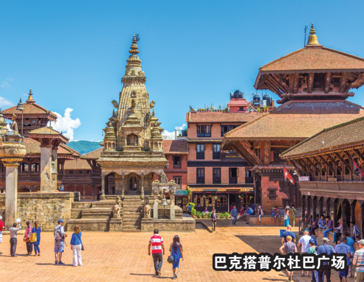
巴克塔普尔杜巴广场