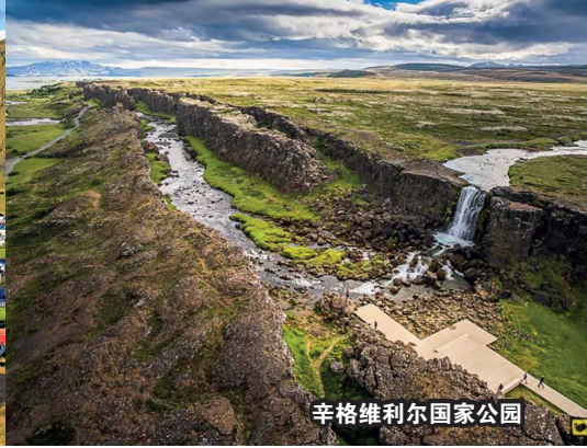
辛格维利尔国家公园