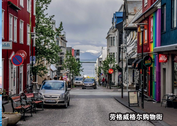
劳格威格尔购物街