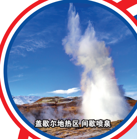
盖歇尔地热区 间歇喷泉