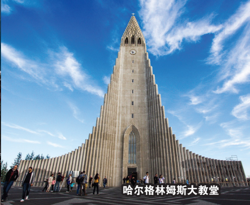
哈尔格林姆斯大教堂