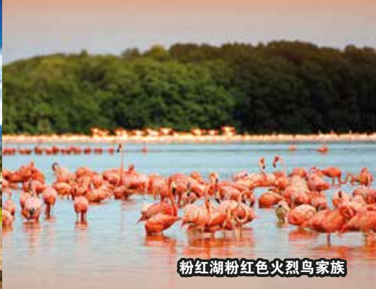
粉红湖粉红色火烈鸟家族