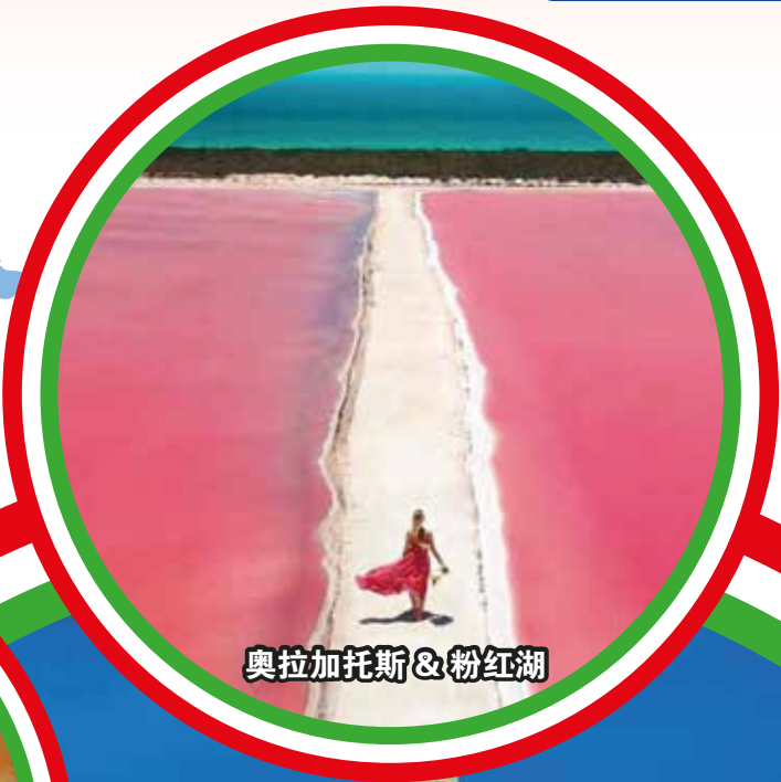
奥拉加托斯 & 粉红湖