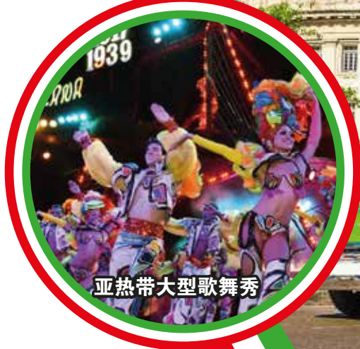
亚热带大型歌舞秀