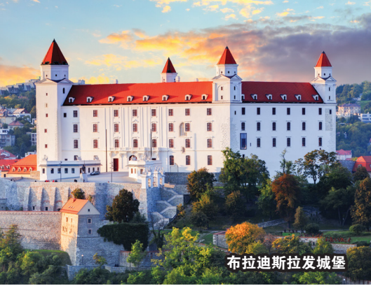
布拉迪斯拉发城堡