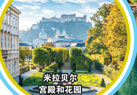
米拉贝尔 宫殿和花园