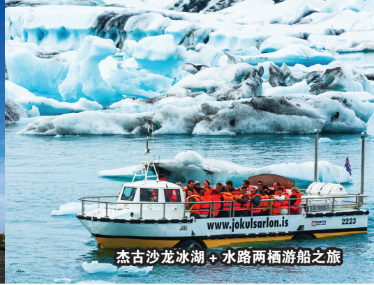
杰古沙龙冰湖 + 水路两栖游船之旅